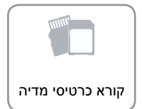
קורא כרטיסי מדיה